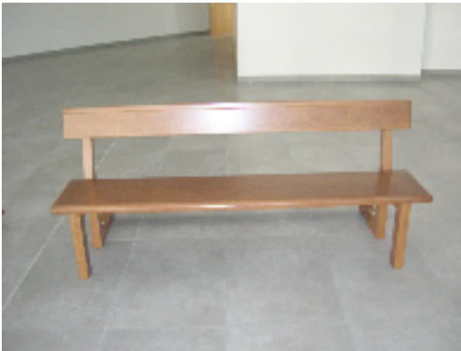
Model de banc escollit.

Aquí posarem l'altar major, l'ambó i la seu.