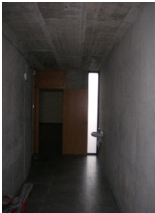
Caldrà mobiliari per a la sagristia.