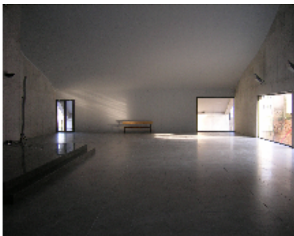
Omplir l'església de bancs i de nous fidels.

Després de demanar pressupostos a diverses empreses i escollint aquelles que ens oferien millor relació qualitat-preu, amb el Consell d'Economia de la parròquia hem calculat que per a fer possible tot això necessitem un pressupost de 60.000 €, que desglossem així: