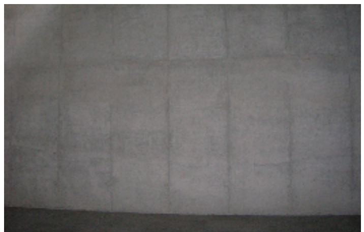
Lateral, on ubicarem l'orgue.